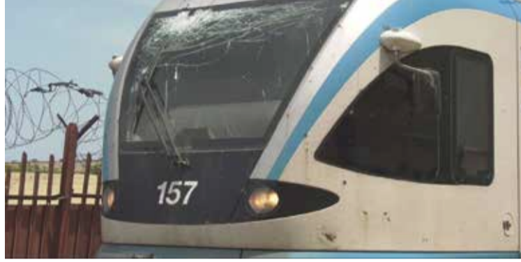
في عملية الرشق بالحجارة بإخضاع مركبته للمتابعات القضائية.

توعدت الشركة الوطنية بالنقل بالسكك الحديدية، بمتابعات قضائية في حق المتسببين في الاعتداءات على القطارات، بعد أن كشفت عن مشاهد صادمة لهذه الاعتداءات، معلنة عن تسجيل أكثر من 200 حادثة رشق بالحجارة وأزيد من 20 إصابة بشرية سنويا.